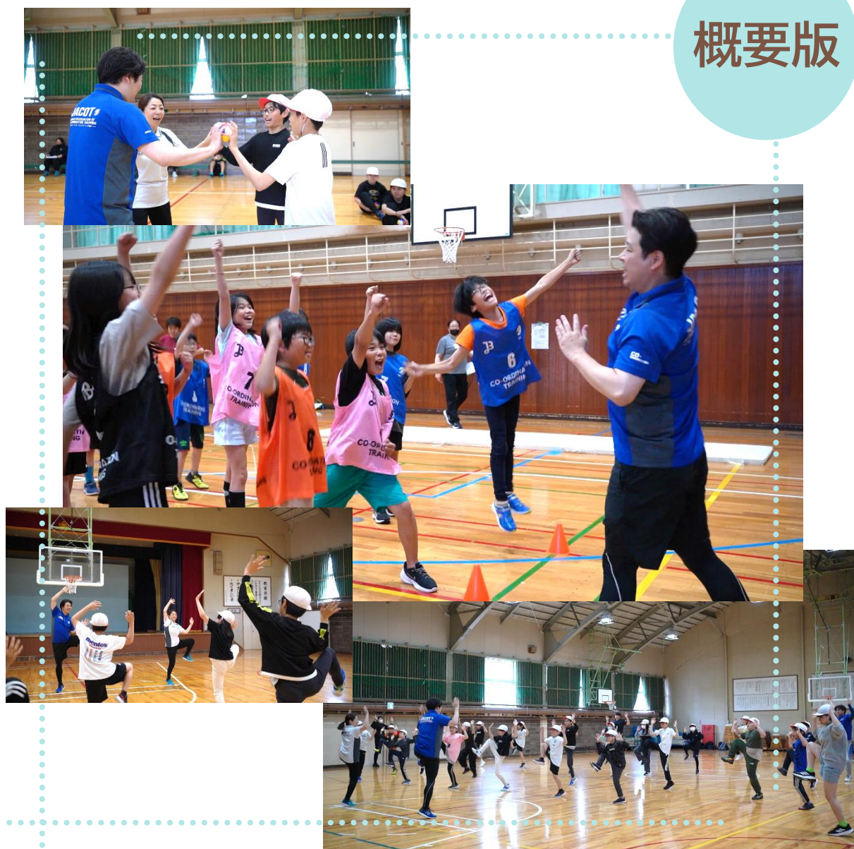
コーディネーショントレーニングの様子