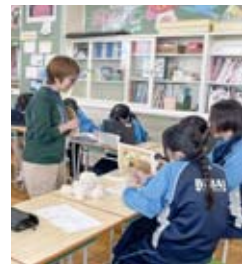
市内の学校と連携した授業プログラムに取り組んでいる様子