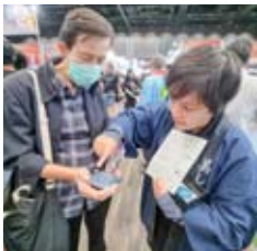
イベント出展を通じて海外の方へ美唄の魅力を伝えている様子