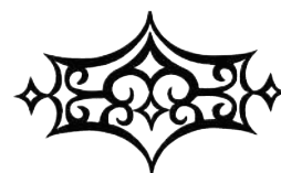
『東西蝦夷山川地理取調図』 松浦武四郎