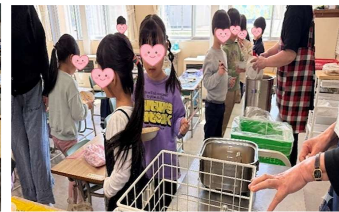
東小学校 13日（月）、マーボ丼・イカリングフライ・バンサンスウ。