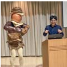
タイ文化を楽しむ交流会を開催している様子