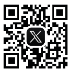
▲店舗ホームページ