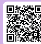
ふるさと美唄 応援店舗情報