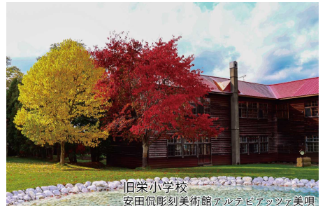
旧栄小学校 安田侃彫刻美術館アルテピアッツァ美唄