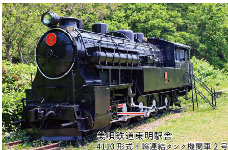
美唄鉄道東明駅舎 4110形式十輪連結タンク機関車2号

鉱メモリアル森林公園でその威容を示しています。また、東美唄地区の旧栄小学校の敷地に、美唄出身の彫刻家・安田侃氏の作品を収めた芸術文化交流施設「アルテピアッツァ美唄」(2016(平成28)年に「安田侃彫刻美術館アルテピアッツァ美唄」に改名)が1992(平成4)年にオープンし、観光資源としても注目されています。旧栄小学校や三菱美唄炭鉱縦坑槽、美唄鉄道東明駅舎、4110形式十輪連結タンク機関車2号、人民裁判事件記録画は、2019(令和1)年5月に「炭鉄港」の構成文化財として日本遺産に認定されています。