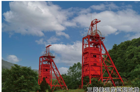
三菱美唄炭鉱縦坑槽