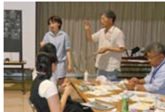
チョークを使った 黒板アート作成講座