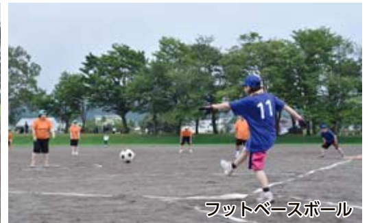
フットベースボール