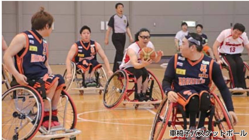
車椅子バスケットボール