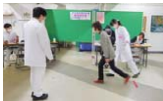
ロコモチェック (移動機能のテスト)