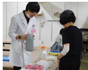
みそ汁の飲み比べ