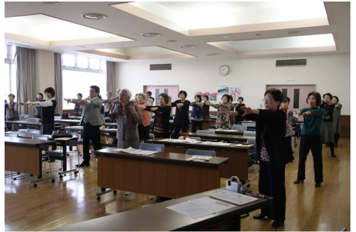
【転倒予防体操の実演】