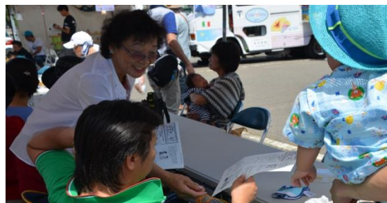
8月の歌舞裸まつりでの啓発活動風景

今後もより多くの方に「男女共同参画」について知っていただくために、さまざまな活動を行っていきますので、会報「Duo」をぜひご一読ください。