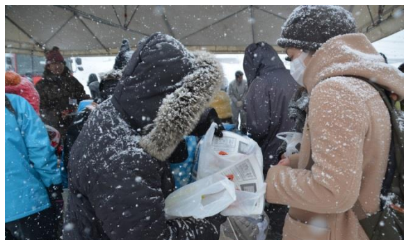
2月の雪んこまつりでの啓発活動風景

今後もより多くの方に「男女共同参画」について知っていただくために、さまざまな活動を行っていきますので、会報「Duo」をぜひご一読ください。