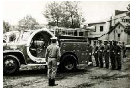
昭和35年ポンプ操法