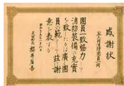
昭和 2 5 年 感謝状