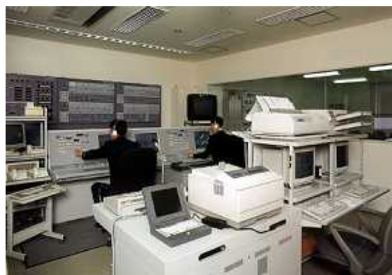
平成8年 指令システム