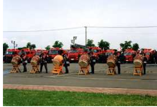
平成8年 女性団員・美消太鼓