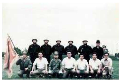
昭和53年 北海道操法大会