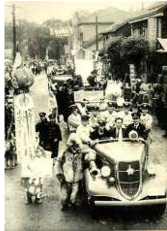
昭和27年50周年記念仮装