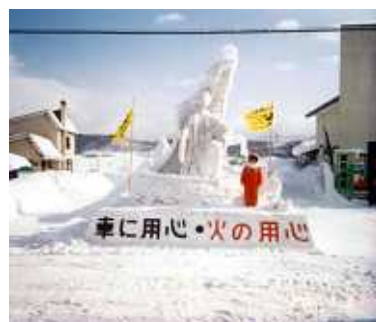
昭和63年 茶志内雪像