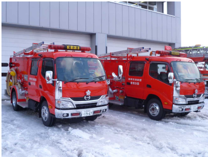
旭分団車及び東明分団車