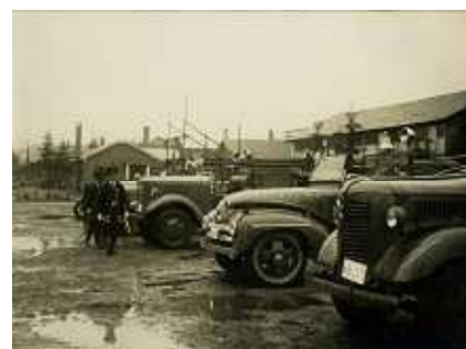
昭和 2 7 年 5 0 周年演習