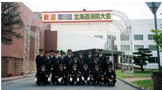
平成15年 北海道消防大会