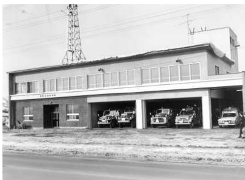
昭和46年築 消防庁舎