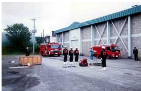
平成7年北海道操法大会出場