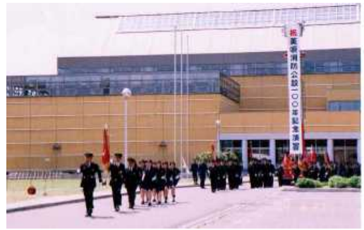
美唄消防公設100年記念式典