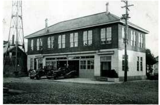
昭和13年築 消防庁舎