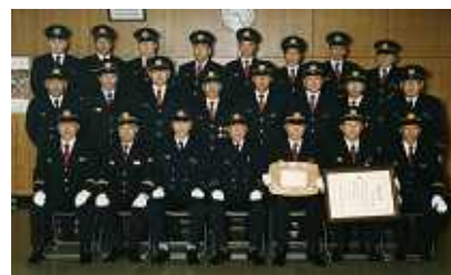
昭和57年内閣総理大臣賞