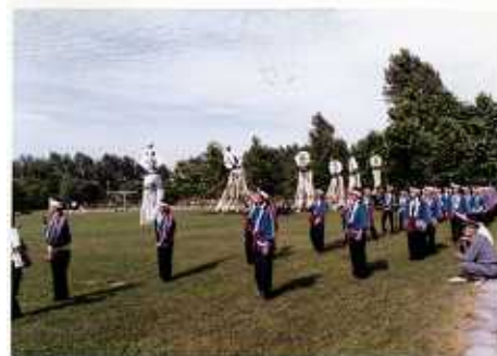
昭和49年キヤリ行進