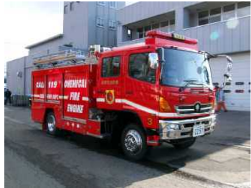
化学消防ポンプ自動車