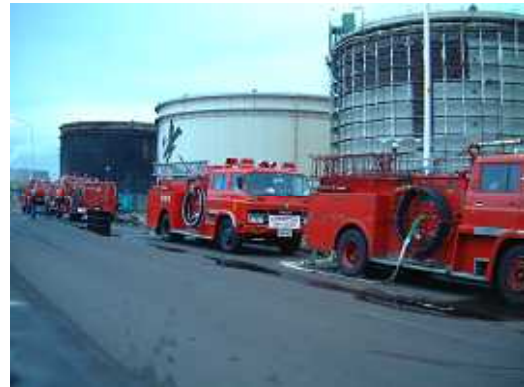
平成15年 北海道広域応援派遣隊