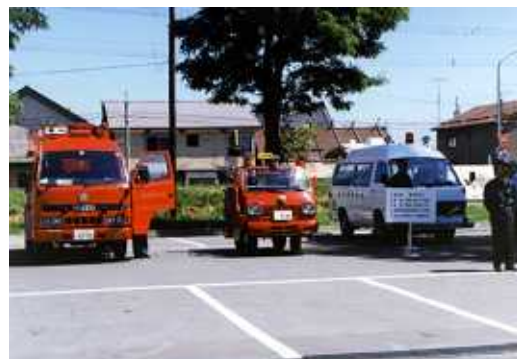
平成2年 消防本部創立40周年