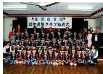
平成4年幼年消防クラブ結成式